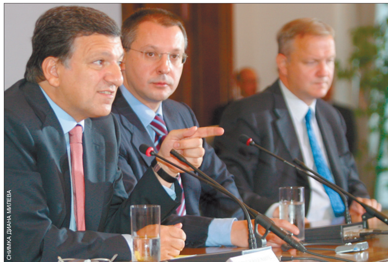
Пратениците на Европа Жозе Барозу (вляво) и Оли Рен казаха, че присъединяването на България е исторически момент за ЕС

Няма да се самоуспокояваме, ще докажем, че българите могат, заяви Сергей Станишев